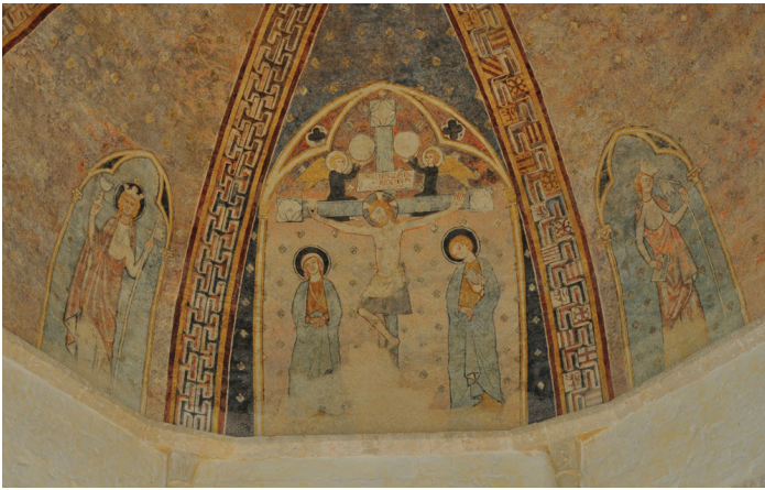
▲ Édifice religieux de 1062 à 1791