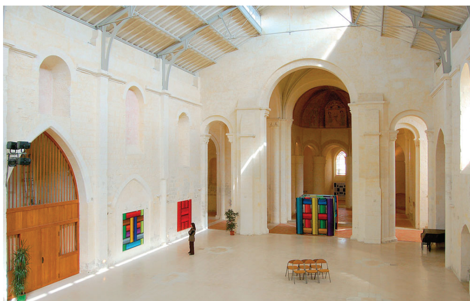
▲ Vue de la nef et du coeur depuis la mezzanine

■ Prix / Distinction / Label Le chœur et le transept sont classés au titre des Monuments Historiques depuis 1955 Les parties médiévales de la Nef sont inscrites à l'inventaire supplémentaire des monuments historiques en 1992