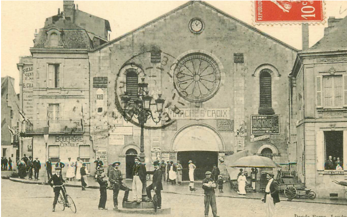
▲ Vocation commerciale de 1892 à 1991