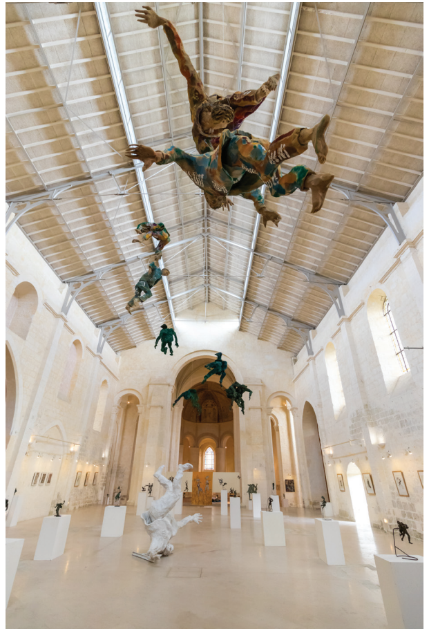
▲ Équipement culturel de 1995 à aujourd'hui