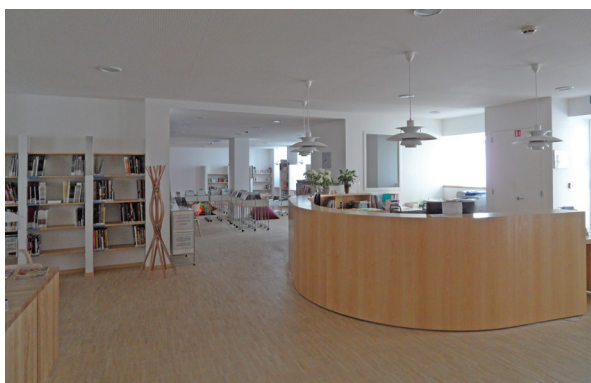
▲ Vue intérieure médiathèque