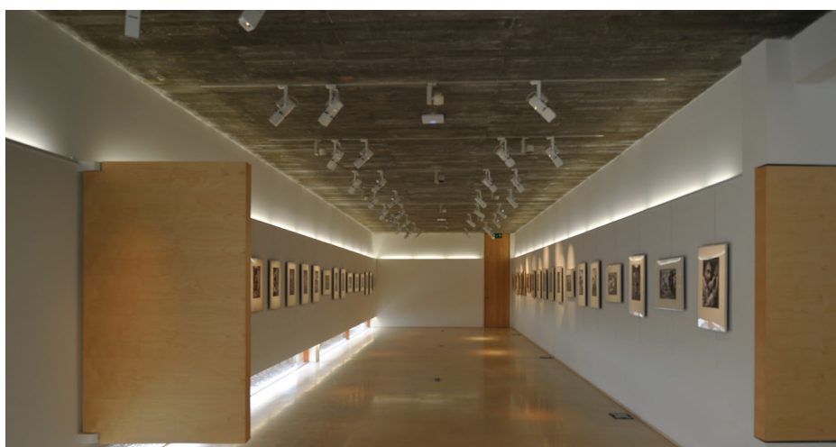
▲ Vue sur un des espaces d'exposition