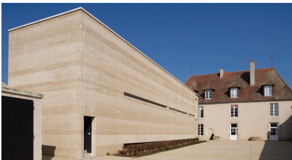
▲ Intégration de l'extension dans l'ensemble bâti XVe