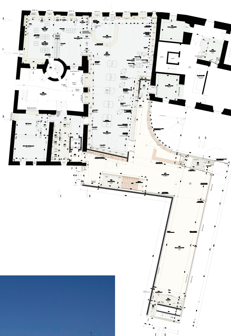
▲ Plan du rez-de-chaussée