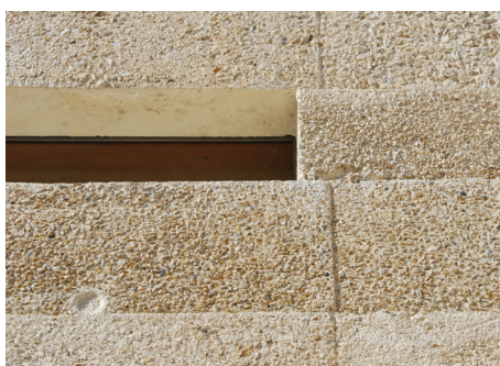
▲ Détail béton de site

L'équipement s'inscrit dans un ensemble historique comprenant plusieurs bâtiments du XVI et du XIX ème . Les bâtiments anciens sont restaurés et reconvertis et une extension a été implantée dans la cour existante. La galerie accueille, au rez-de-chaussée, les expositions temporaires et à l'étage une partie du musée. La galerie a été construite avec un béton de site, coulé par strates successives de hauteur et de granulométries différentes. La paroi texturée, à l'aspect très naturel, rappelle les couches archéologiques dans lesquelles les pierres gravées ont été trouvées. La porte monumentale de l'entrée est habillée de planches de robinier conservées dans leur état naturel. Les ouvertures de la galerie sont des fentes horizontales très fines placées au ras des planchers, laissant libre, la totalité des cimaises. Du côté de la MJC, la paroi s'infléchit en courbe avec de ouvertures verticales. Les fenêtres en bois sont disposées en applique, du côté extérieur. Le vitrage est tenu par des plats en acier inoxydable sablé ce qui lui donne un très bel aspect mat. A l'intérieur, une paroi coulissante qui se ferme entièrement en porte à faux - sans rail haut ni bas - permet de séparer la galerie du hall d'accueil.