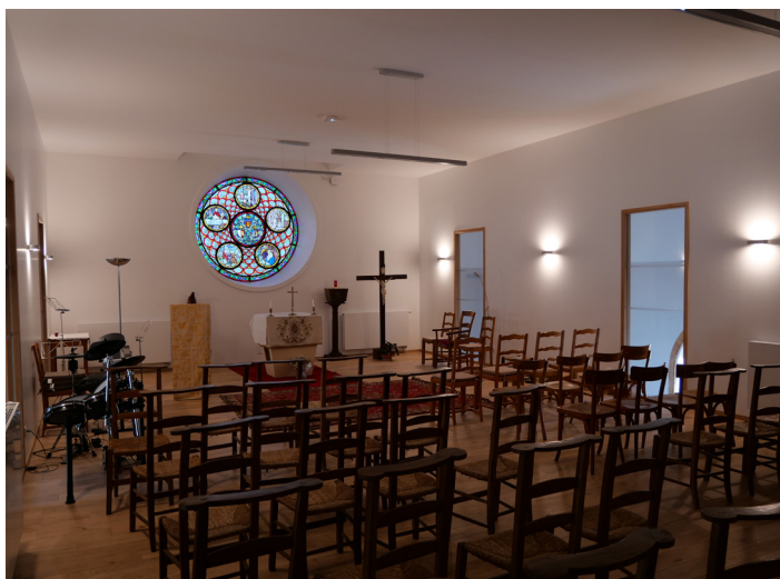
▲ Intérieur de la chapelle