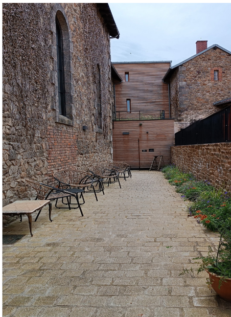
▲ Entrée de service