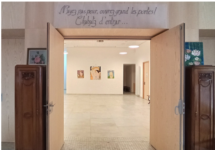
▲ Entrée salle d'exposition