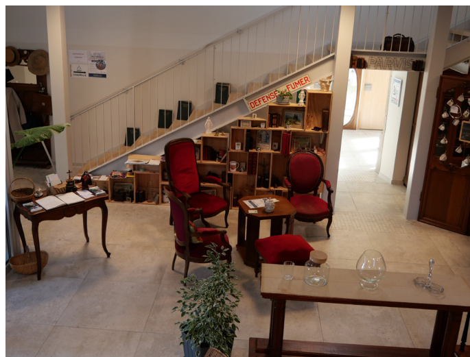
▲ Salle du café solidaire