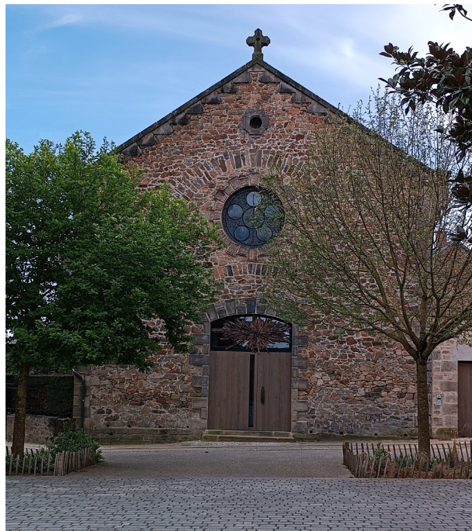
▲ Entrée principale de face avec les vitraux de la chapelle