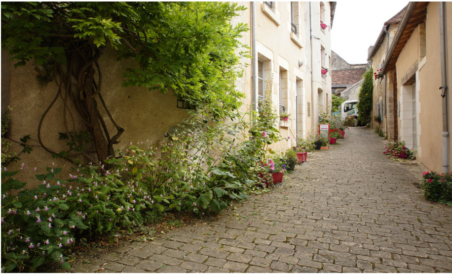
▲ Rue de l'Arceau