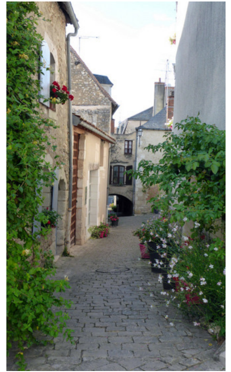
▲ Rue de l'Arceau