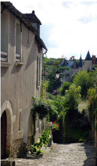
▲ Rue de la Cueille