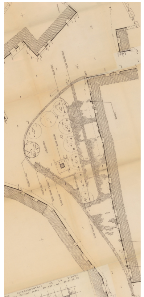
▲ Plan masse place centrale