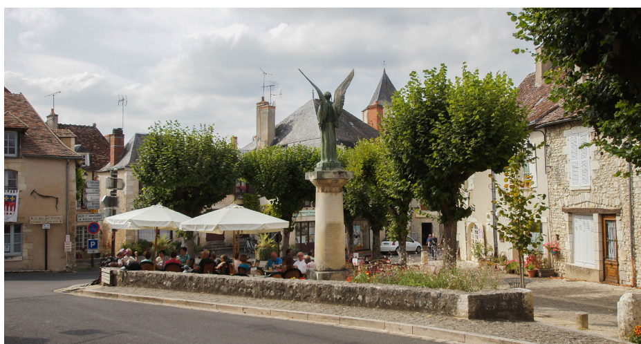
▲ Place centrale