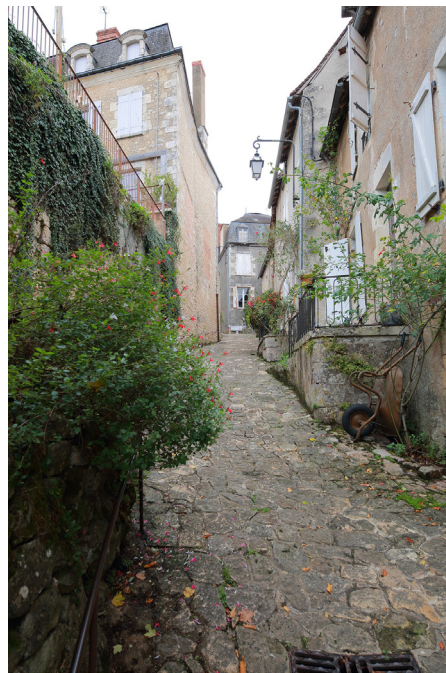
▲ Rue de la Cueille