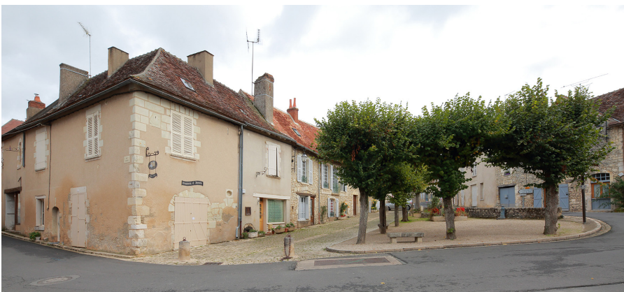
▲ Place centrale