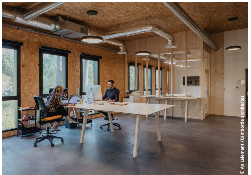
▲ Vue sur un atelier d'artiste

Concrete Jungle est un lieu dédié à la création. Il accueille trois ateliers d'artistes (peintres, photographes, plasticiens, graphistes), un atelier d'architecture, et un atelier d'art culinaire.