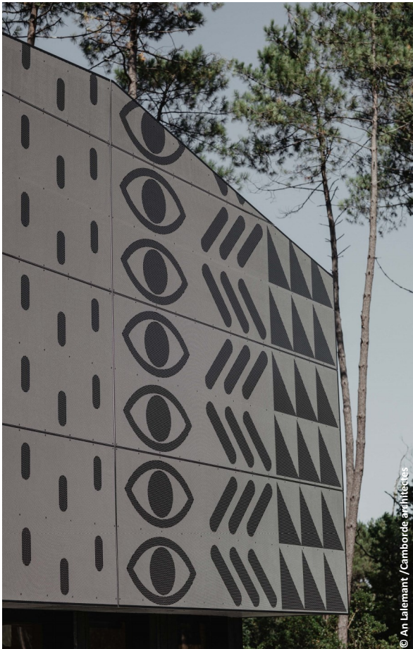
▲ motifs ethniques extraits des œuvres du maître d'ouvrage