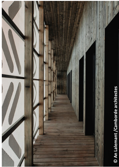
▲ Couloir de distribution