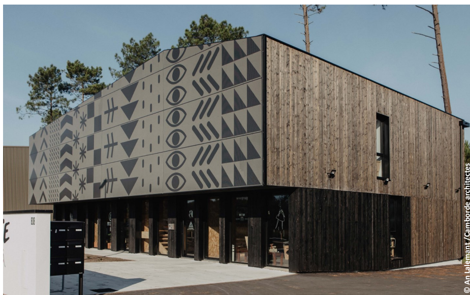
▲ Façades Sud et Est

Le projet s'implante à proximité de l'océan au sein la zone d'Activités Pédebert en cours d'extension. Le lot sur lequel s'implante le bâtiment est de taille modeste et de forme rectangulaire, bordé au sud par la voie nouvelle et son cheminement piéton. Au nord, il est situé en lisière de la pinède caractéristique du paysage landais.