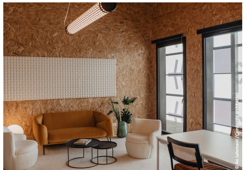
▲ Vue sur la salle de pause

Dalle basse : Plancher hourdis sur vide-sanitaire Façade : Mur ossature bois et bardage bois autoclave gris et bois brûlé. Plancher mixte : bois / béton Toiture : Charpente et bac Acier.