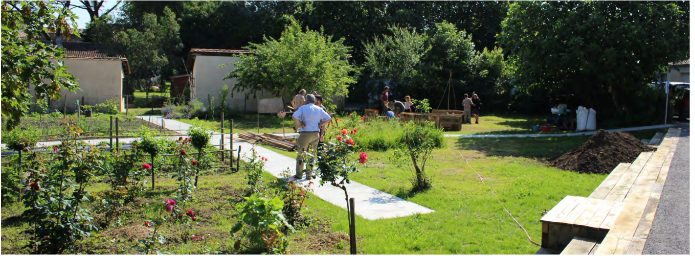
▲ Vue d'ensemble du jardin