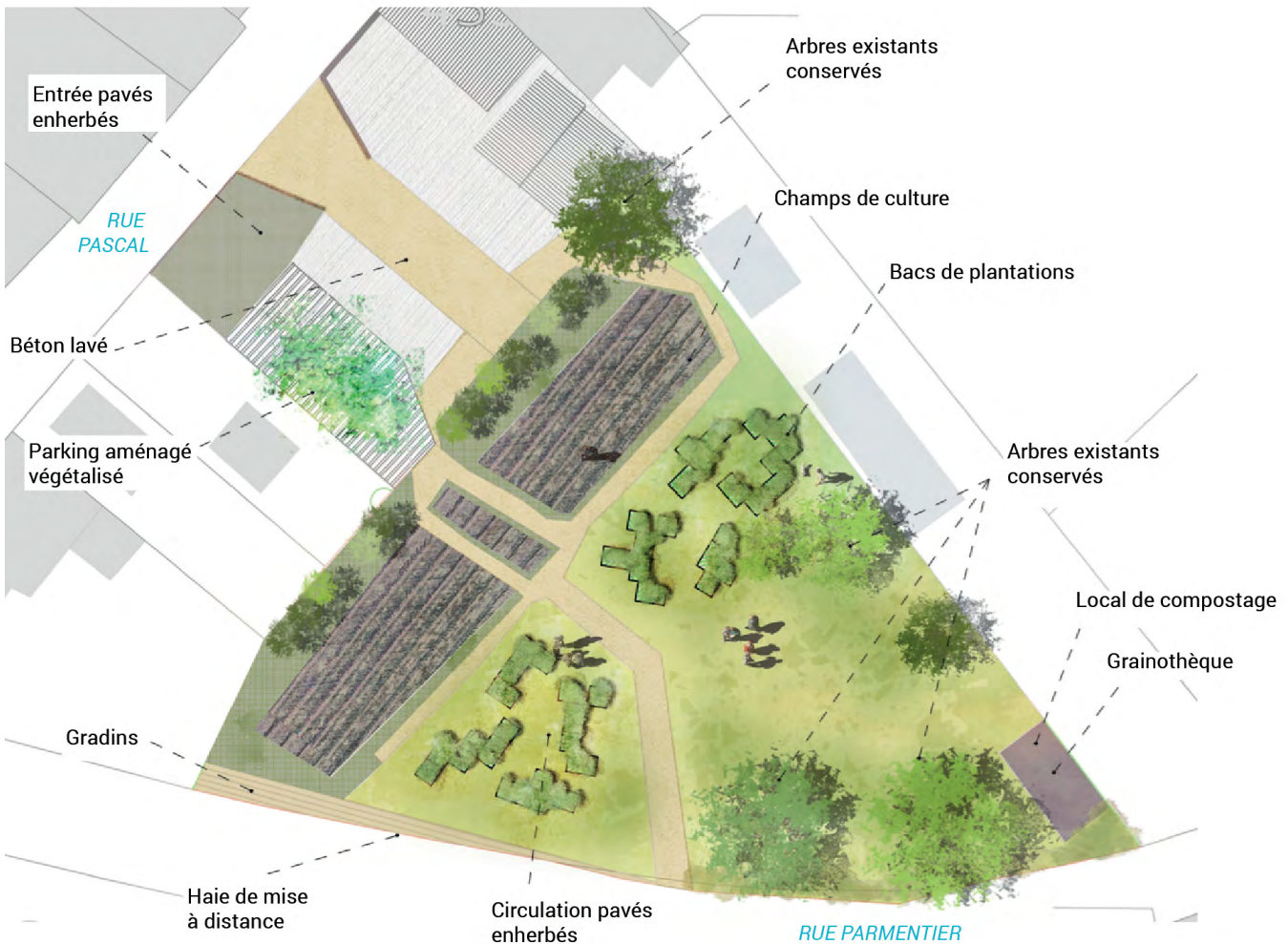
▲ Plan des aménagements par l'agence d'urbanisme ©KWBG