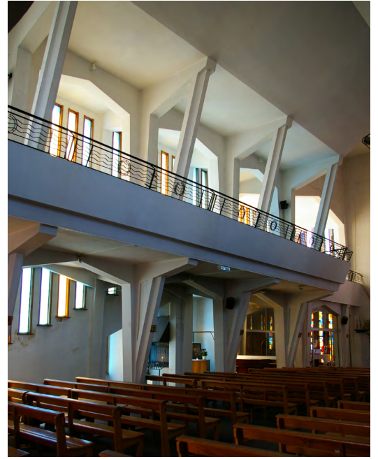
▲ Vue des tribunes éclairées par ces ouvertures.