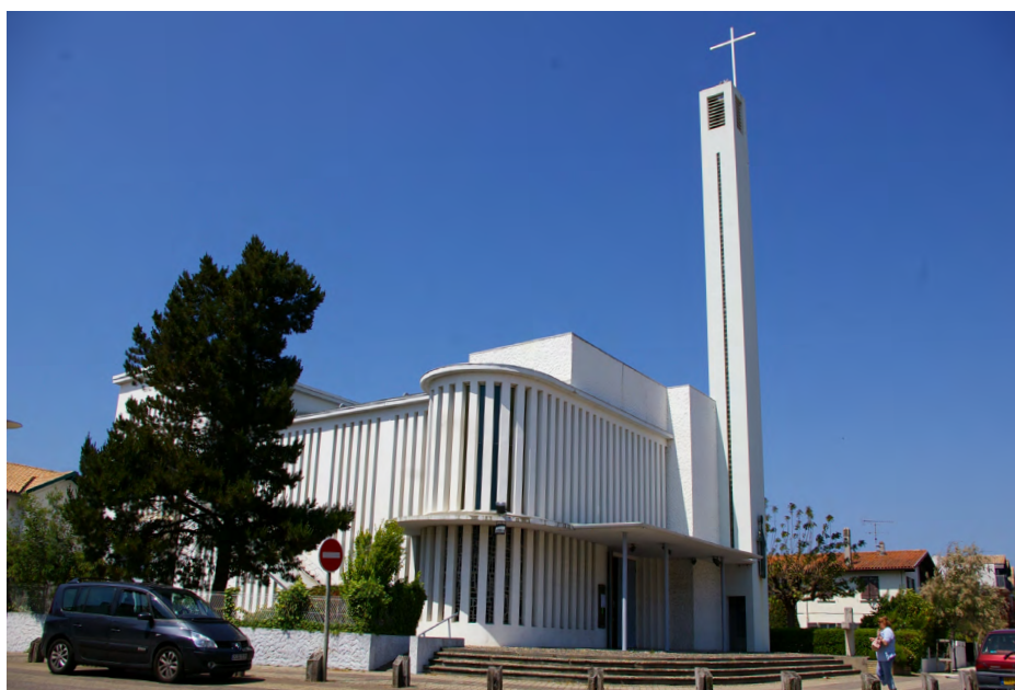
▲ De haut en bas : Vue rapprochée des vitraux abstraits colorés // L'église vue de la rue