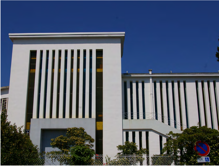
▲ La façade sud et ses grandes ouvertures verticales aux encadrements colorés.

https://lecapferret.net/2015/04/20/leglise-notre-dame-des-flots-du-cap-ferret-histoire/