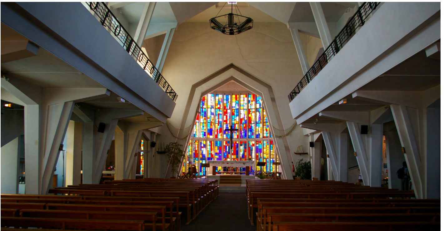
▲ Vue de la nef, et au fond sur les vitraux abstraits colorés.