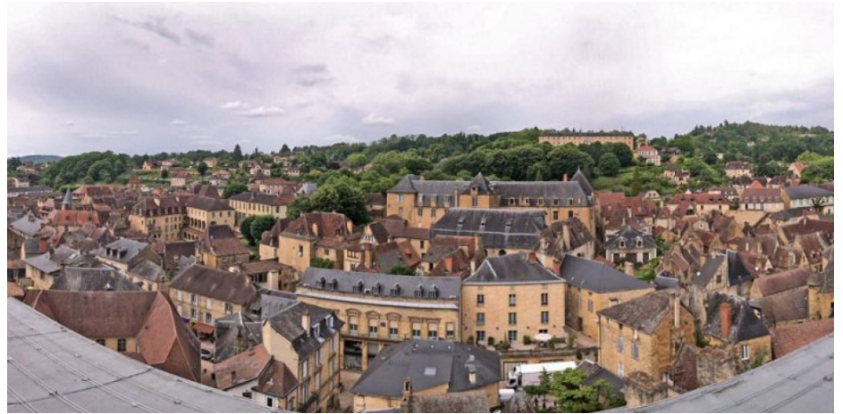
▲ Panorama depuis l'ascenseur

http://www.jeannouvel.com/projets/eglise-sainte-marie/