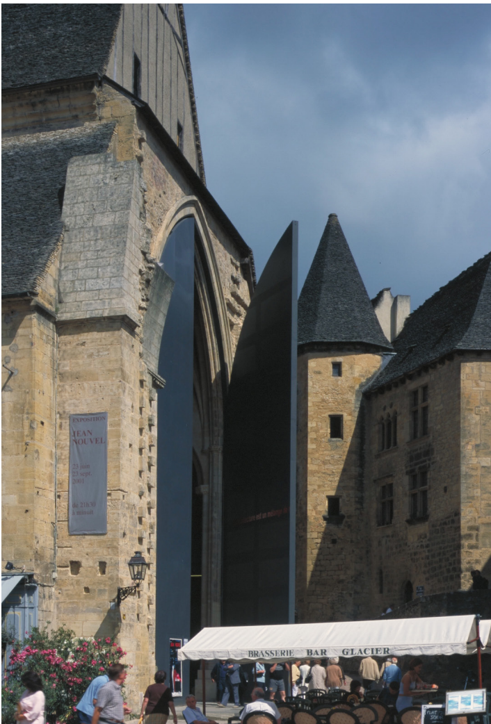
▲ Portes monumentales et rosace épurée