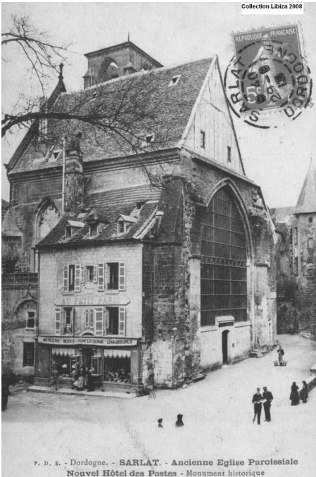
▲ L'église milieu XXème, alors Hôtel des Postes

Cette intervention audacieuse sublime l'histoire du lieu, par son parti brut qui valorise les détails et modénatures de l'ancienne église et des édifices historiques de la place. L'ancienne église est devenue un incontournable touristique.