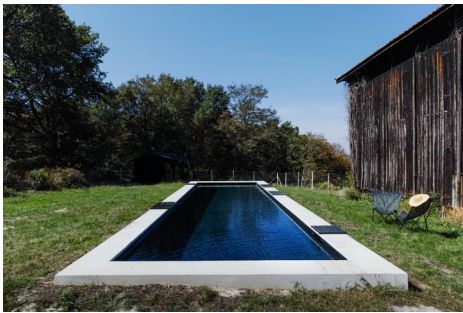
▲ La piscine se fait discrète, derrière le séchoir à tabac et habillée de noir.