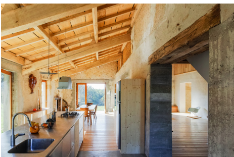
▲ La partie habitation «hiver» fait la part belle aux matériaux bruts.