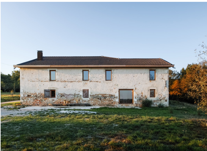
▲ Façade Nord : des additions récentes ont été démolies afin de retrouver la lisibilité du volume.