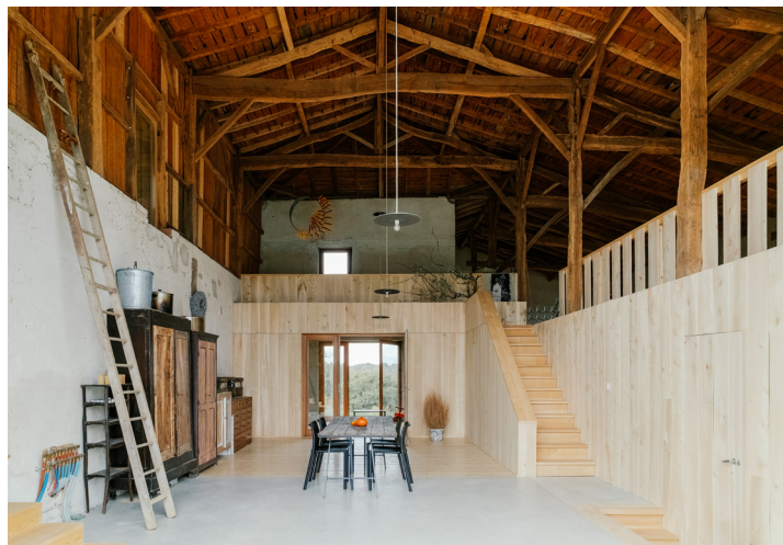
▲ Dans la partie « été », la charpente conservée est mise en valeur par le nouveau volume bois des chambres (à droite).