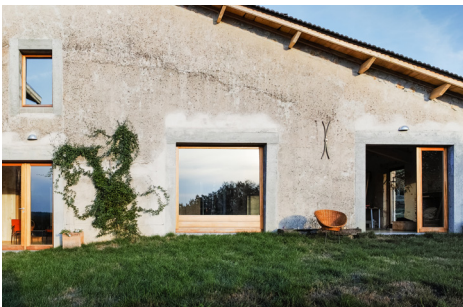
▲ Les ouvertures conservées ont servi de modèle pour les nouvelles, dimensionnées pour le passage du bétail dans l'ancienne ferme.