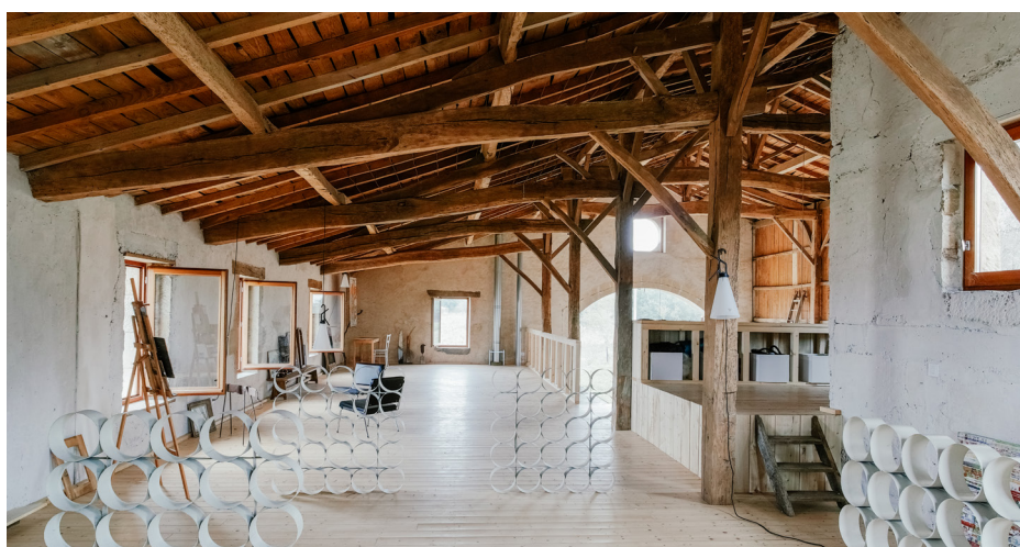
▲ Ici l'espace « été » sert tour à tour de dortoir, d'espace de réception ou même de bureau.