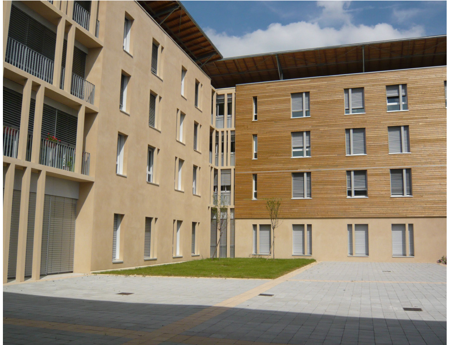
▲ Vue depuis la cour