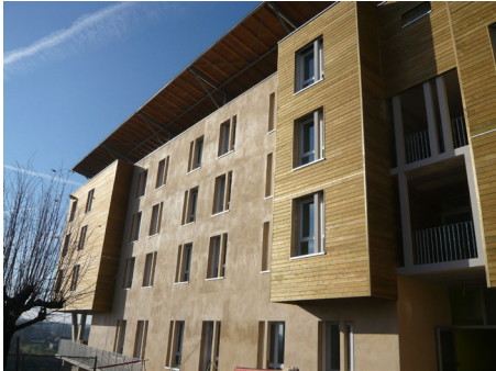
▲ Vue extérieure de l'Hôpital

www.ledorat.fr/ hôpital la Josnière https://ateliers4.fr