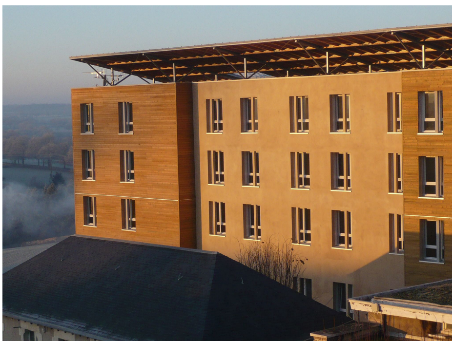
▲ Hôpital La Josnière