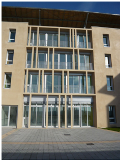
◀ Entrée de l'Hôpital