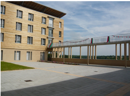
▲ Passerelle vue de la cour