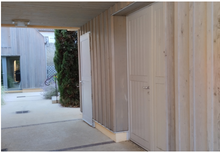
▲ Le passage couvert est habillé de bois prégrisé

En fond de cour, une ancienne annexe ouverte est remaniée, close et bardée du même bois prégrisé utilisé en façade sur rue. Ce bardage vertical se retrouve par touche sur la façade du restaurant et plus récemment sur les façades de la salle des fêtes, à quelques pas de là, réhabilitée par le même cabinet d'architecture.