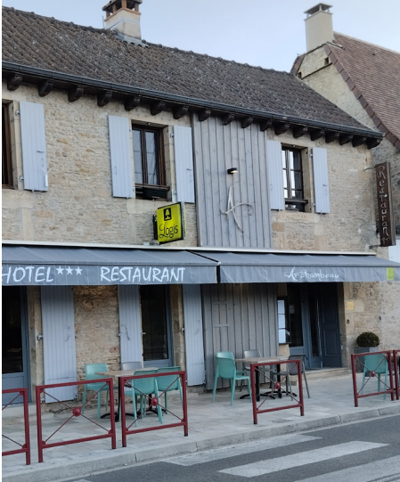
▲ Bardage bois en rappel sur la façade du restaurant

https://www.hotel-restau-archambeau.com/