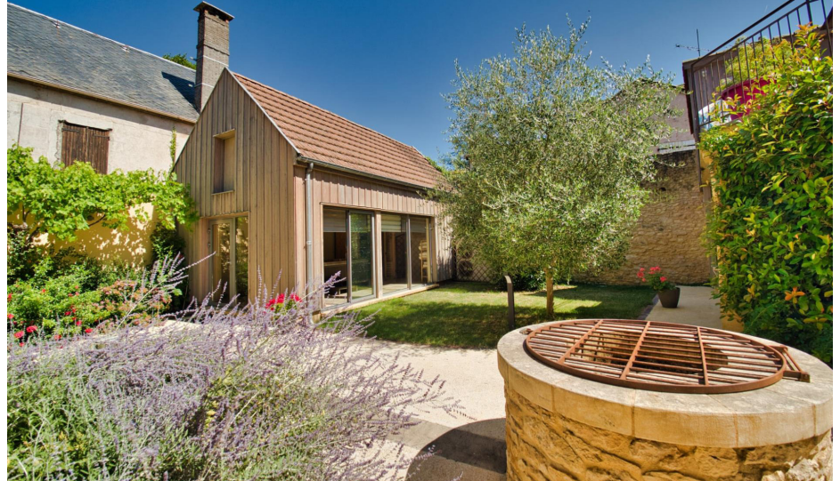
▲ Ancienne annexe restructurée en un espace spa, au coeur de l'îlot