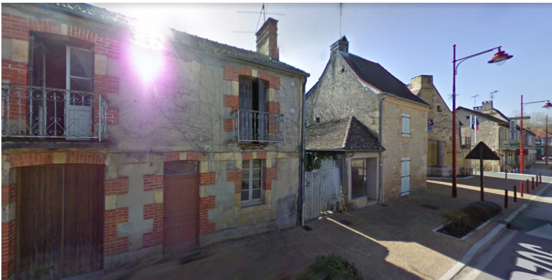
▲ Ancien garage / boutique détruit et remplacé par un nouveau volume sur 2 niveaux