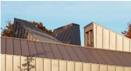
▲ Volumétrie et pentes des toitures