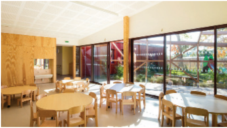
▲ Vue intérieure du réfectoire

https://issuu.com/caue44/docs/confort_sante__