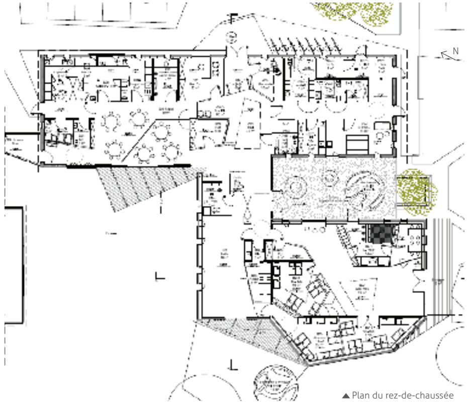
▲ Plan du rez-de-chaussée