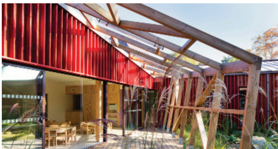
▲ Vue du réfectoire ouvert sur l'extérieur

■ Prix / Distinction / Label Lauréat 2016 du Concours « Paysages et Architectures » organisé par le Parc naturel régional des Landes de Gascogne et les CAUE de la Gironde et des Landes /Catégorie Equipements publics