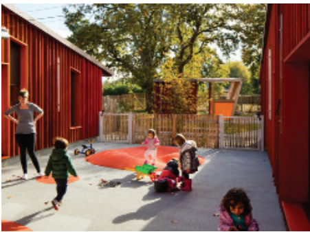
▲ Vue de la cour extérieure