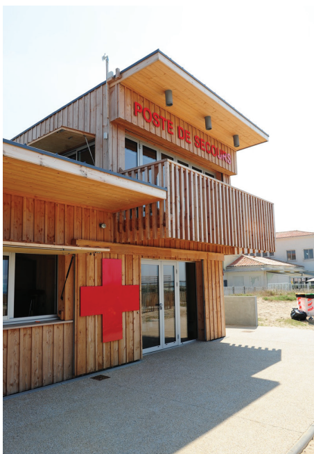
▲ Vue de l'entrée du bâtiment