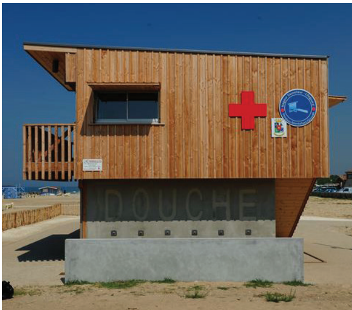
▲ Le volume s'étire et s'ouvre vers le balcon qui permet la surveillance de la plage

http://www.littoral-aquitain.fr/tourisme-amenagements-durables/poste-de-secours-innovant