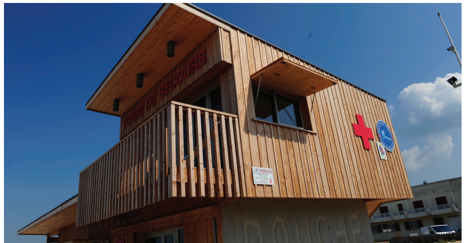
▲ La vue panoramique permet une surveillance optimale de la plage