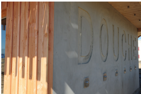
▲ Alliance bois & béton côté douches publiques