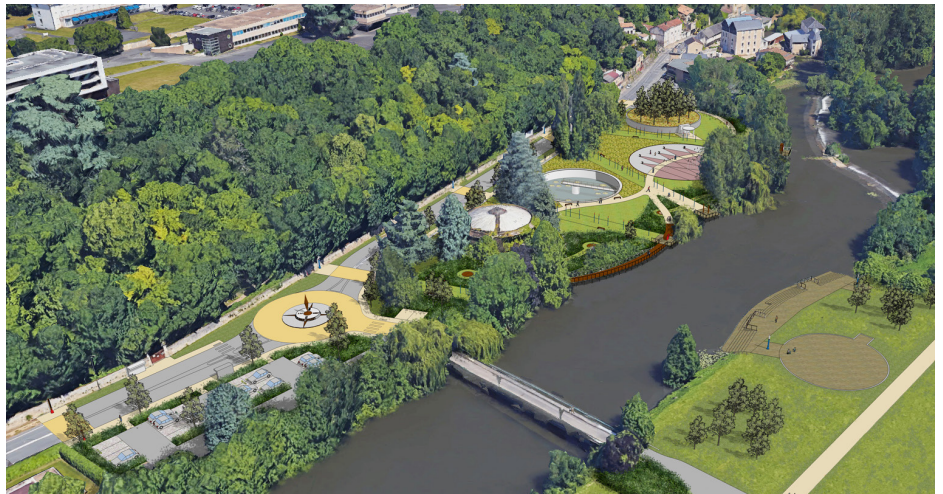
▲ Vue aérienne du projet (phase PRO)