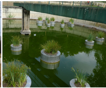
▲ Fabrique aquatique (décanteur)