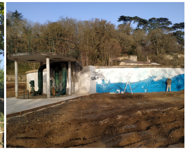
▲ Fabrique signal (clarificateur)