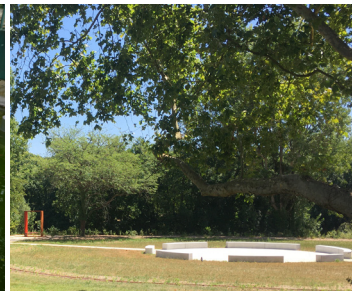
▲ Fabrique épurée (digesteur)