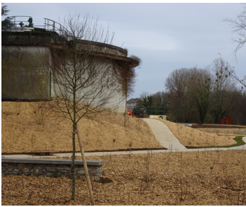
▲ Fabrique fantôme (digesteur)