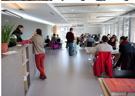
▲ Salle de lecture