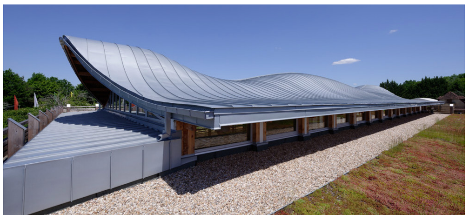
▲ Toiture en zinc à double courbure et toiture végétalisée