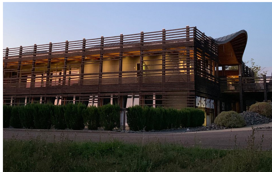
▲ Le bardage en mélèze à pose ajourée dynamise la façade et accentue les jeux de lumières