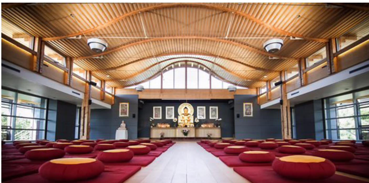
▲ Le temple, tout en lumière et en courbes