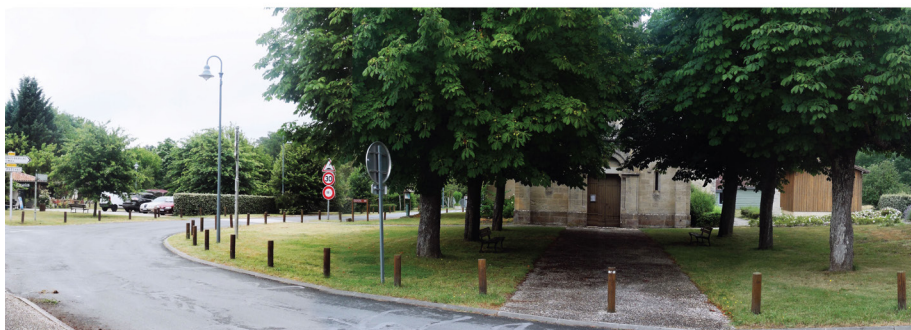
▲ Avant / après les travaux : vue du parvis de l'église