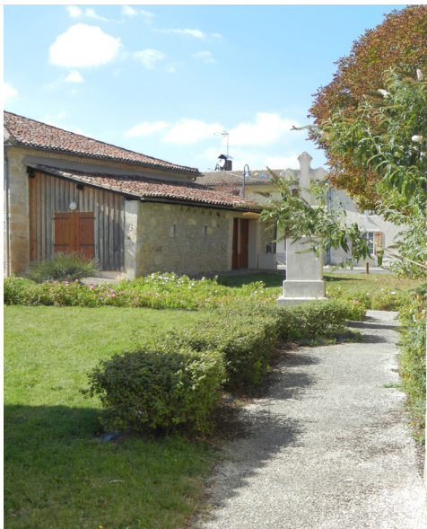
▲ Les cheminements bordés par le végétal

Côté mairie, des massifs fleuris sont installés et dessinent le chemin, permettant également de dissimuler le parking , comme le bosquet de bouleaux du côté du monument aux morts.