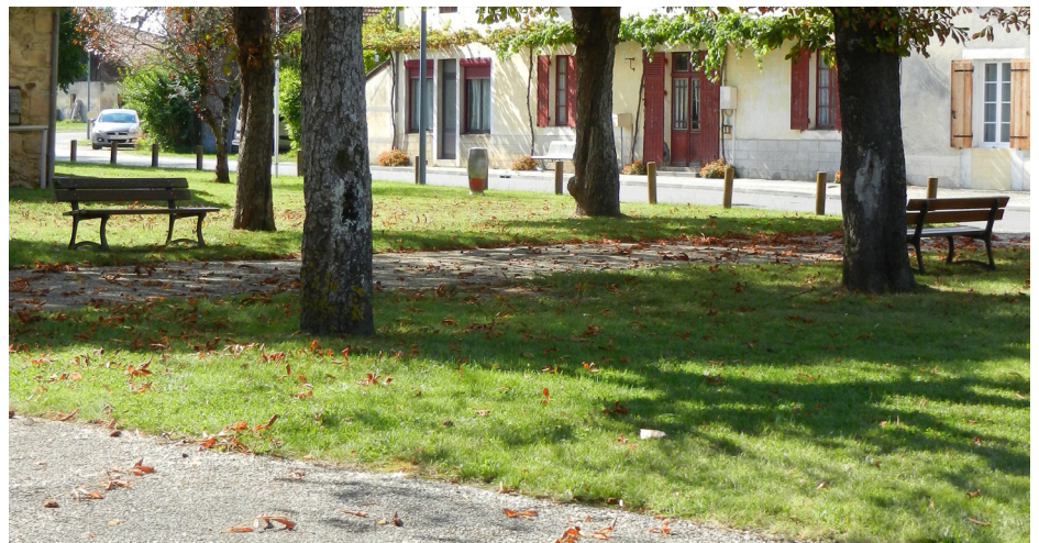
▲ Aménagements des allées et délimitation des espaces par des potelets en bois