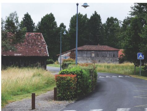
▲ Avant / après les travaux : vue de la voirie