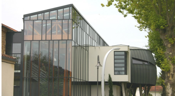
▲ Le SYDEC : extension contemporaine adossée à l'ancienne infirmerie