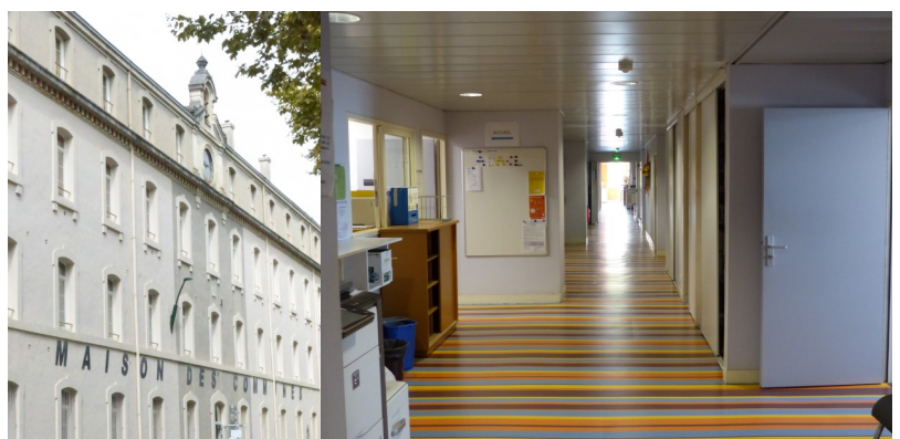
▲ Les bureaux de la Maison des communes : restructuration du bâtiment de commandement

Le site a également accueilli des programmes de constructions. Ainsi, en 2012 sur l'emprise de l'ancienne place militaire, la médiathèque du Marsan a pris place (12,3M€). Et les 7 hectares de la partie arrière du parc ont quant à eux été dédiés à l'habitat avec 350 logements dont 100 logements locatifs sociaux et 250 en accession à la propriété mais aussi à quelques programmes de bureaux (ADIL 40 , CAUE 40, Pôle emploi, UDAF).