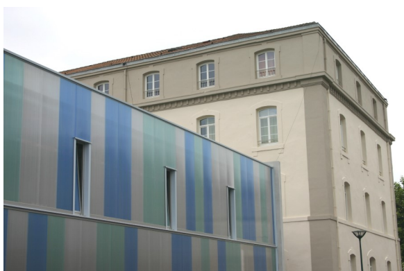
▲ Les bureaux de l'Afpa : extension contemporaine

Puis, l'ancien bâtiment de commandement a été entièrement rénové pour abriter la Maison des communes (6M€). Le syndicat départemental d'électricité et d'eau (SYDEC) s'est installé à l'Ouest dans l'ancienne infirmerie. Le Conseil Régional et l'Afpa ont quant à eux profité d'un grand bâtiment à l'Est pour créer un Centre de Formation permanent pour Adultes (3M€). Dans ce même bâtiment, le Centre Régional des Oeuvres Universitaires et Scolaires (Crous) y a installé 70 chambres pour étudiants. Enfin les associations ont investi 2 bâtiments existants en arrière du site (Maisons des associations).