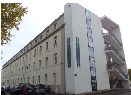
▲ La Maison des syndicats : création des accès par l'extérieur

Une première phase du projet qui s'est terminée en 2006, a porté sur la réhabilitation de 3 bâtiments à l'Ouest : les archives départementales (8,37M d'euros), et la Maison des syndicats (1M d'euros).