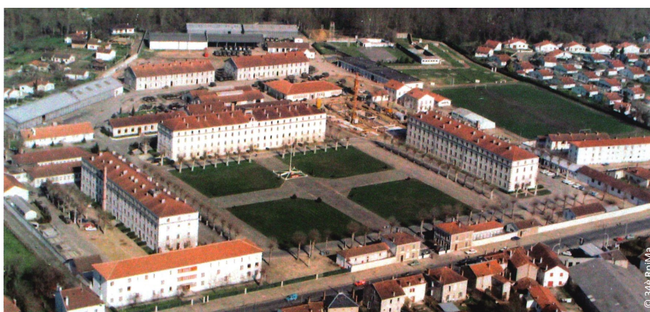
▲ Le site de la caserne Bosquet en 1981