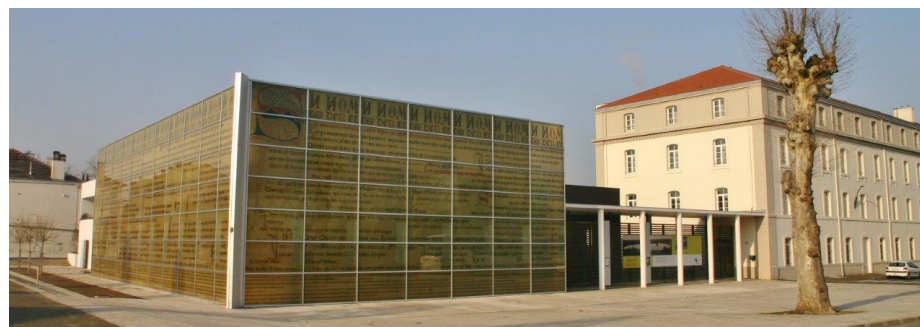
▲ Le s archives départementales : restructuration de l'existant et extension contemporaine