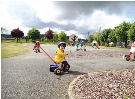
▲ Vue d'ensemble actuelle de la cour, avec les espaces venant d'être plantés pour devenir favorables à la biodiversité