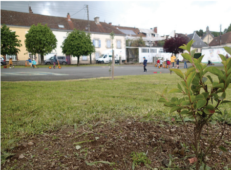
▲ Plantation de très jeunes arbres en complément des arbres fruitiers de plus grand développement

https://www.lamontagne.fr/crocq-23260/actualites/un-jardin-extraordinaire-dans-la-cour-d-une-ecole-maternelle-de-creuse_14330407/