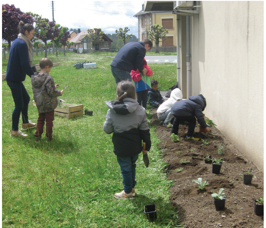
▲ Réalisation des plantations favorables aux pollinisateurs sauvages