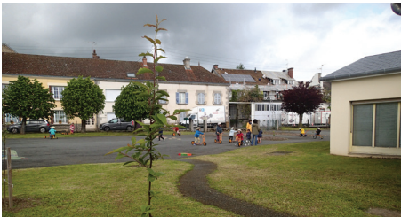
▲ Maintien de la surface en enrobé existante et plantation d'arbustes et d'arbres