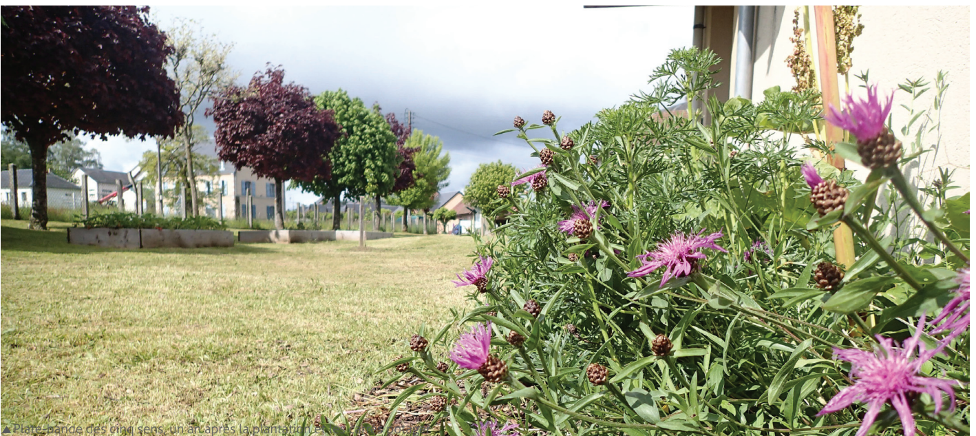
▲ Planche bande des cinq sens, un an après la plantation